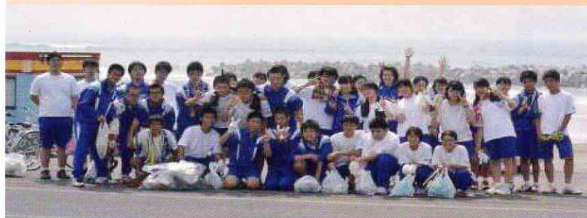
7/16 西目海水浴場清掃ボランティア

私たち西目中学校3年生は、「総合的な学習の時間」の活動で、自分たちを育ててくれたこの西目地域に恩返しをしようと考えました。そこで、「見る」「遊ぶ」「食べる」「買う」「学ぶ」「くつろぐ」という視点でこのまちを見つめ直し、リーフレットにまとめました。